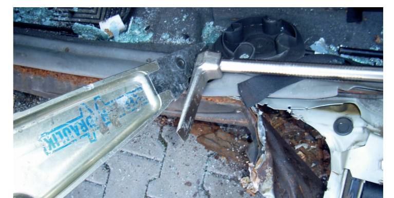
Eingeschlagenes Halligan als Ansatzpunkt