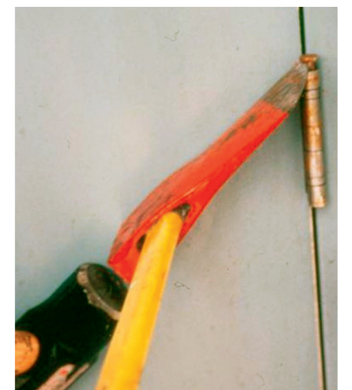
Austreiben des Scharnierbolzens