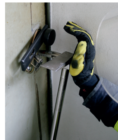
Durchtreiben des Schließzylinders