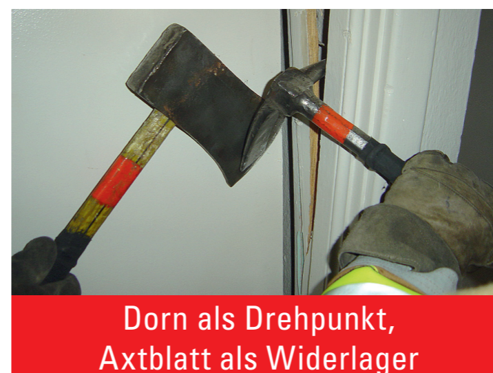
Dorn als Drehpunkt, Axtblatt als Widerlager