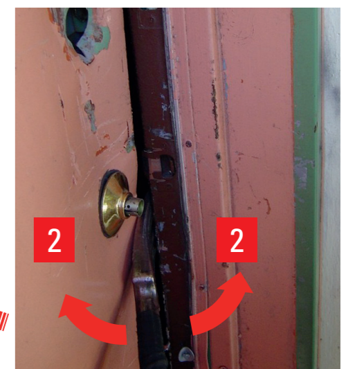
Aufhebeln mit Klaue