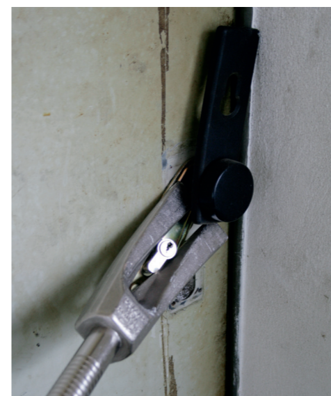
Abscheren des Schließzylinders