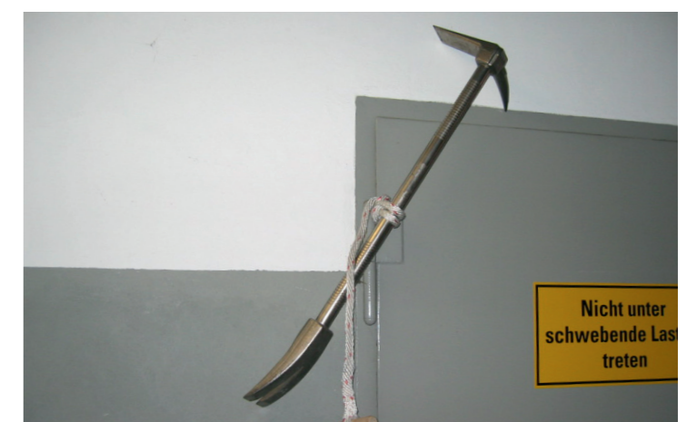
Halligan als Festpunkt