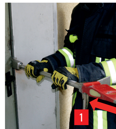
Einschlagen der Klaue