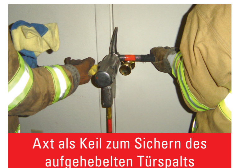
Axt als Keil zum Sichern des aufgehebelten Türspalts