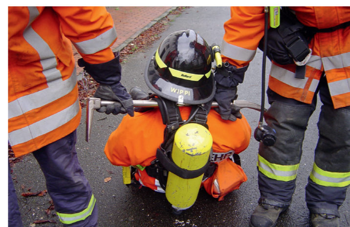
Halligan als Hilfsmittel bei Atemschutznotfällen