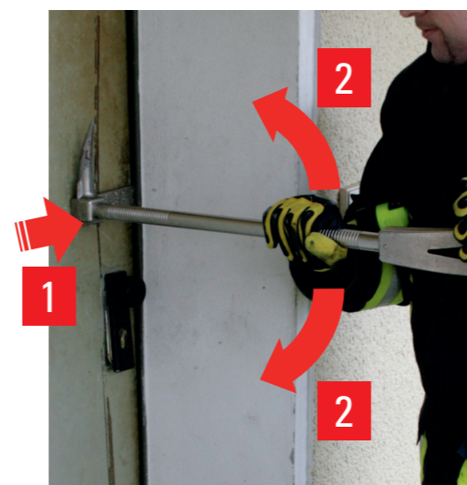
Klinge als Hebel

Ideal ist die Kombination aus Halligan, Axt und Vorschlaghammer. Für ein besseres Handling wurden hier die Griffe mit Reepschnur und Lenkerband umwickelt.